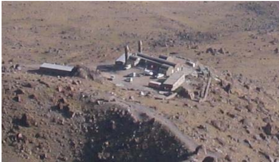
پناهگاه شمال شرق

از پناهگاه تا قله حدود ۴:۳۰ راه هست (با کوله سبک) که اکثر مسیر شیب بسیار تندی دارد؛ به همین خاطر آگه بخواهید خیلی تند برید، شاید با مشکل مواجه بشید. بعد از رسیدن به سنگ محراب (یه سنگ بزرگ و صاف) تا دریاچه حدود ۲۰ دقیقه راه هستش و از اینجا به بعد مسیر راحت می‌شه. از پناهگاه تا قله کل مسیر پاکوب مناسبی دارد و کلبش پرچم‌گذاری شده، پاکوب‌ها خیلی جاها زیاد هست، بخاطر همین خوبه که سعی کنید از پرچم‌ها دور نشید.