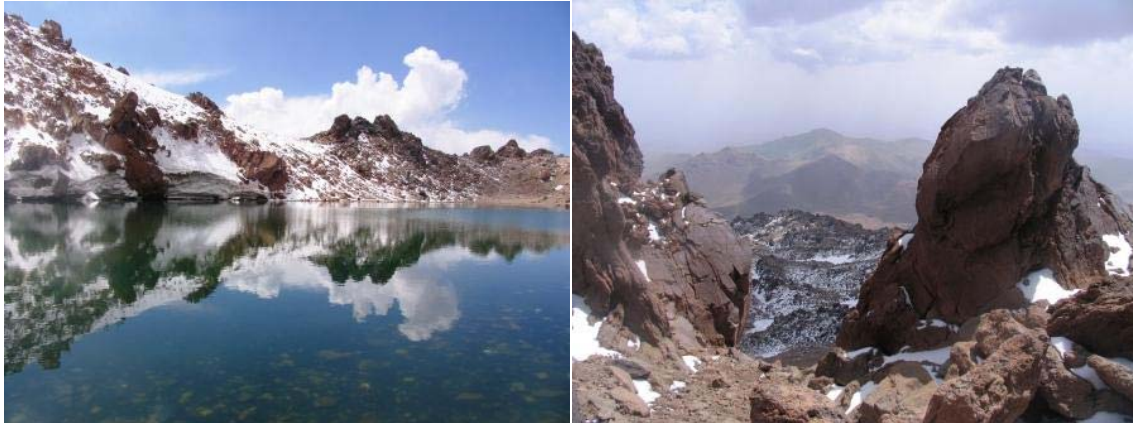
بخش سنگی قبل از قله و دریاچه‌ی قله

دامها می‌باشد. جوی‌های زیادی در دامنه یافت می‌شود که اکثرا قابل خوردن نیستند و برای خوراک دامها مناسباند.