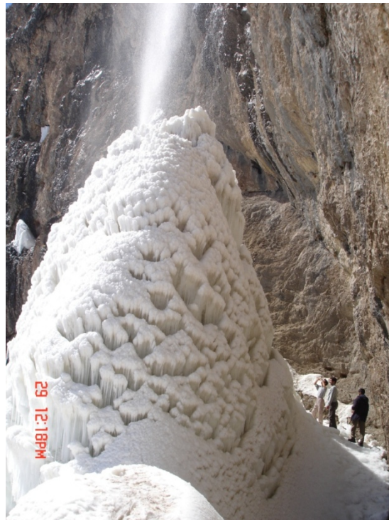
منظره آبشار در زمستان

رفتن به این آبشار در تمام فصول سال زیبایی‌های خاص خود را دارد. اگر به سمت راست آبشار حرکت کنیم، به سلسله آبشارهای دیگری برمی‌خوریم که چندان زیبایی کمتری نسبت به خود آبشار ندارند.